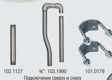
102.1127 3/4": 103.1990 101.0179 Подключение сверху и снизу