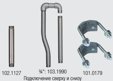
102.1127 3/4": 103.1990 101.0179 Подключение сверху и снизу