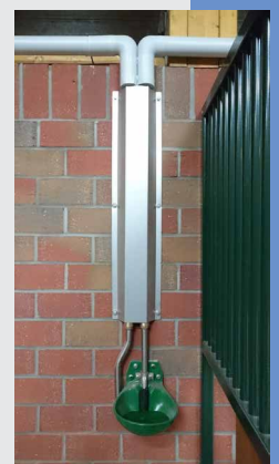
103.1958 mit Mod. 12P