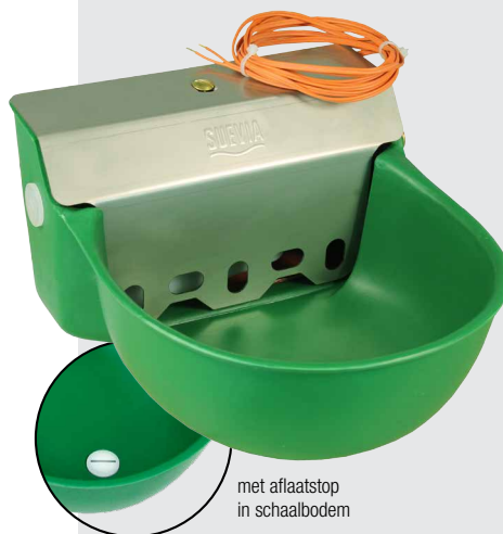
met aflatstop in schaalbodem

OOK ZONDER VERWARMING LEVERBAAR » ZIE P. 8