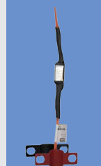
101.1405 Ventiel-verwarming 24 V, 5 W