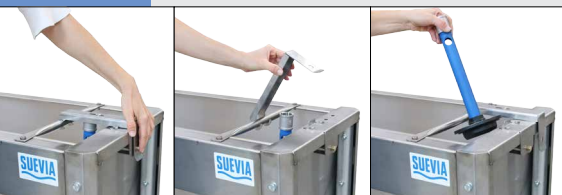
Stopfenhalter DE LUXE:

einfachstes Öffnen und Schließen des Ablaufs oberhalb der Wasseroberfläche