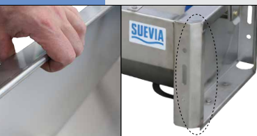
abgerundete Kanten am Trog und abgerundete Ecken!