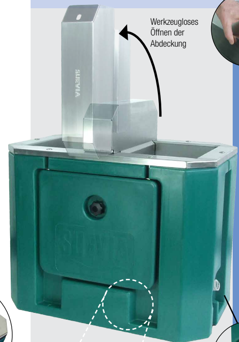
Werkzeugloses Öffnen der Abdeckung