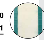
doppelwandig + isoliert