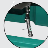
inklusive Panzerschlauch und Frostschutz-Heizleitung 24 V