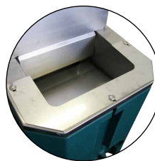
Anti-Schleckrand (Best.-Nr. 131.1193) vermindert Wasserverluste