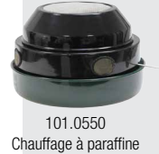
101.0550 Chauffage à paraffine