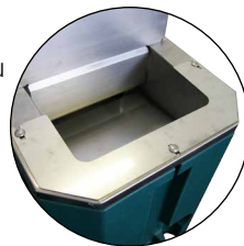
Rebord anti-lapage (réf. 131.1193) limite le gaspillage d'eau