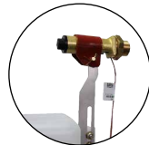
Manchette chauffante 131.0527