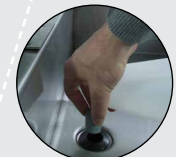
Avec bouchon de vidange en fond de cuve