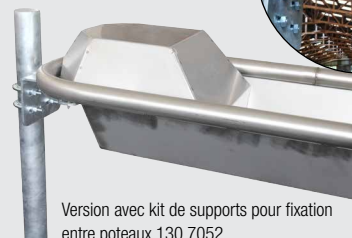
Version avec kit de supports pour fixation entre poteaux 130.7052