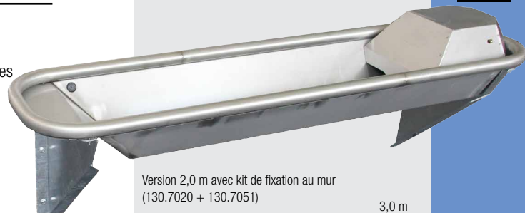
Version 2,0 m avec kit de fixation au mur (130.7020 + 130.7051)