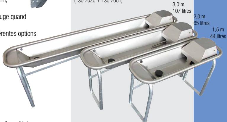
Version avec kit de pieds pour fixation au sol