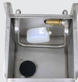
130.6137 Ansicht ohne Ventilabdeckung