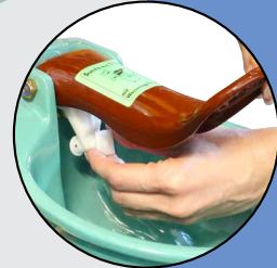
Werkzeuglose Wassermengenregulierung unter der Zunge